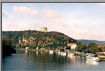
Donau und Befreiungshalle in Kelheim